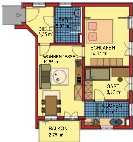
Wohnbeispiel 2: 3-Zimmer, 67,02 qm, Balkon, Einbauküche